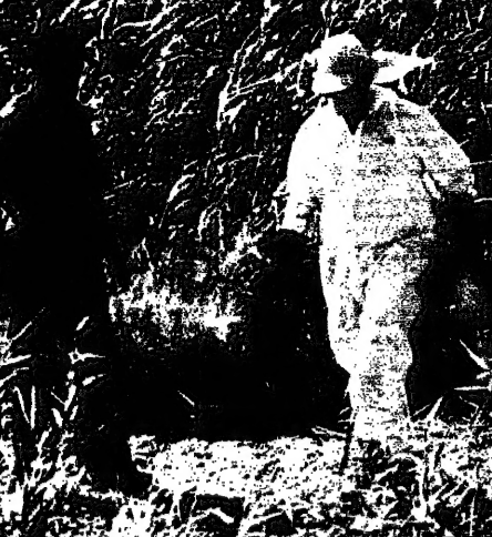
مجلس دولي مع بداية عام (بؤكب)

طه رمضان اعرب عن «عدم ارتياح» لطريقة الاعداد للقمة العربية